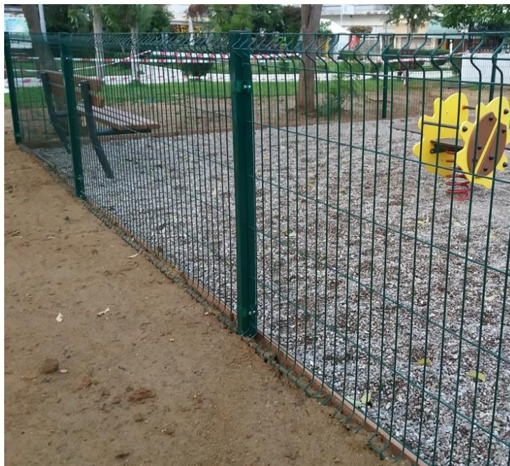
Εικόνα 1: Περίφραξη μεταλλική με δύο νεύρα