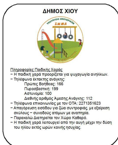
Εικόνα 3: Πινακίδα Εισόδου, Ίδια επεξεργασία, 10-2015

Η πινακίδα τοποθετείται επί των κιγκλιδωμάτων και στερεώνεται επί αυτών με βίδες γαλβανιζέ όπως φαίνεται στην παρακάτω εικόνα.