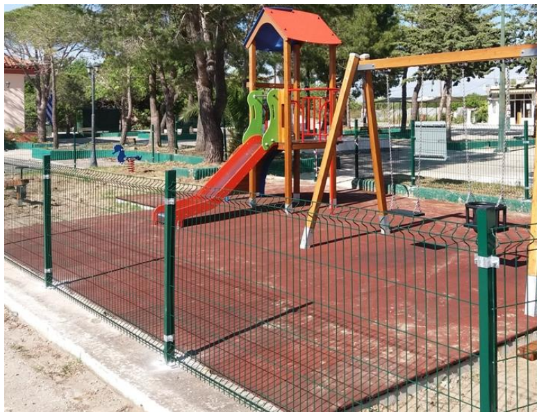
Εικόνα 2: Περίφραξη μεταλλική με δύο νεύρα